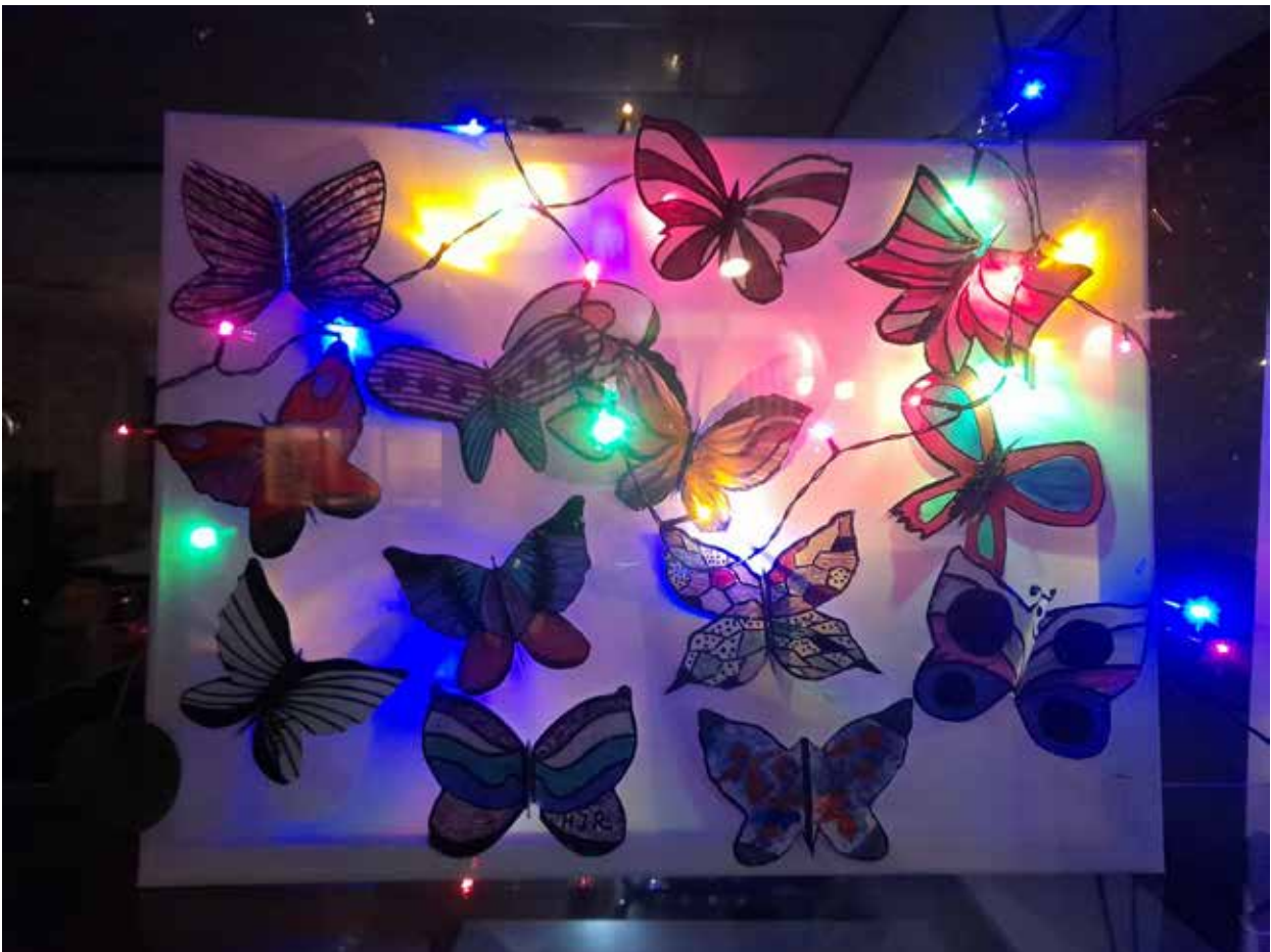
"De vlinders van november", bij nacht in de vitrine aan de Burgwal.