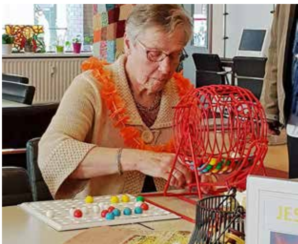
Koningsdag Bingo in Studio Jessehof