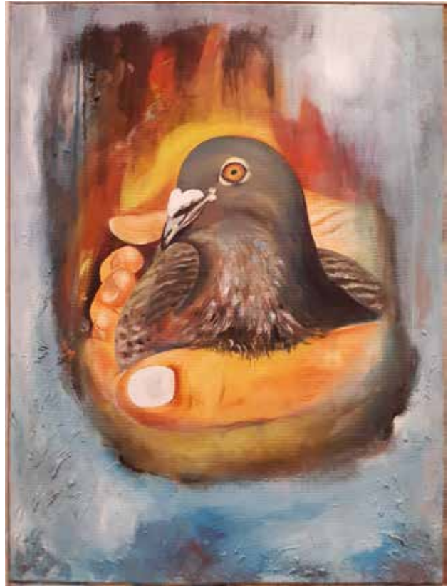
Arshavin Makail - de duif die vrede brengt