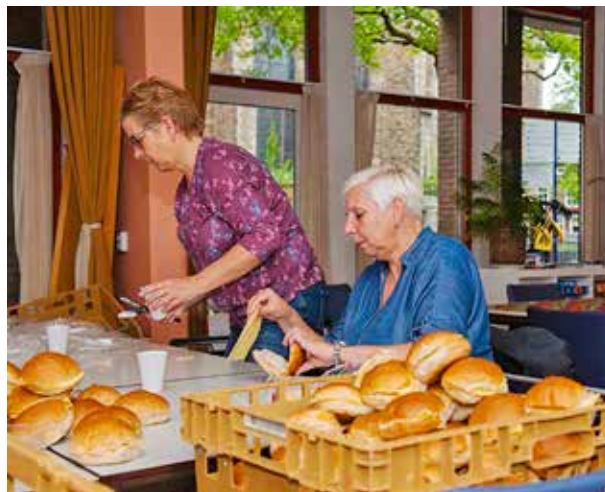
Vrijwilligers van de Goldenloop maken gebruik van de Jessehof