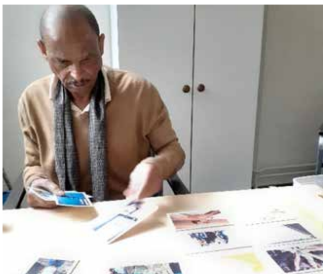
Een bezoeker selecteert zorgvuldig de kaartjes.

De mensen werden gevraagd een selectie te maken van de kaartjes. ‘Wat is belangrijk voor u/jou?’ Door de mensen een ‘top 3’ te laten kiezen kregen we een beeld van wat voor hen het belangrijkste was. Tegelijkertijd vroegen we hen om ‘uitleg’. Dat leverde mooie uitspraken op. (Zie de quotes verspreid in het jaarverslag)