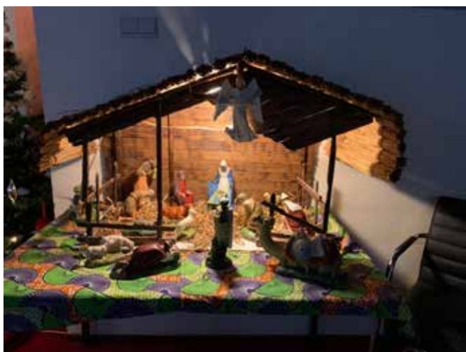
Kerststal in de Jessehof

In dit jaarverslag willen wij graag een woord van dank uitspreken aan alle vrienden van de Jessehof. Om te beginnen aan al onze vrijwilligers die het in het moeilijke corona-jaar volhielden. Die een eigenlijk vreemde houding moesten innemen in ons doorgaans zo gastvrije inloopcentrum. Registreren wie aanwezig zou zijn, letten op de hygiëne van onze bezoekers, mondkapjes, anderhalve meter. De meesten hielden het vol. Maar voor iedereen was duidelijk: leuk is anders.